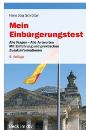
Beck-Rechtsberater im dtv

Für Studium, Prüfung und Praxis: Die gesetzlichen Grundlagen für alle wichtigen Rechtsbereiche. Übersichtlich und sinnvoll zusammengestellt und hervorragend lektoriert. Auf Beck-Texte im dtv können sich Ihre Kundinnen und Kunden verlassen.