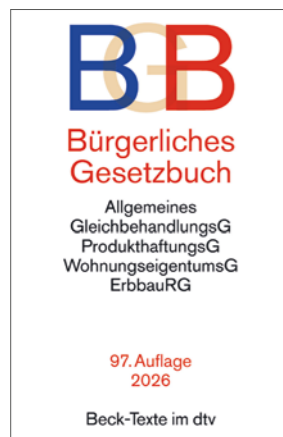
Beck-Texte im dtv

Themen schnell und klar auf den Punkt gebracht, daher leicht verständlich und exakt auf die jeweilige Zielgruppe zugeschnitten.