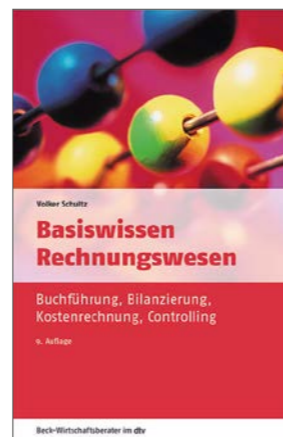
Beck-Wirtschaftsberater im dtv

Zu allen täglichen Rechtsfragen – ob Ehe, Miete oder Beruf: In den praktischen Beck-Rechtsberatern im dtv bringen erfahrene Anwältinnen und Anwälte das Recht schnell auf den Punkt. Mit vielen Beispielfällen und Musterformulierungen, die Leserinnen und Leser sicher durch die Untiefen des Rechts führen.